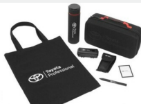
Zestaw prezentowy Professional Gadżety