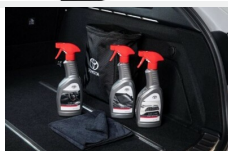
Zestaw kosmetyków samochodowych Toyota Kosmetyki