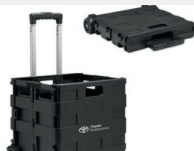
Skrzynka bagażowa Gadżety